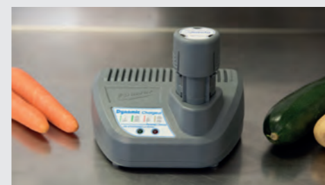
Inklusive Ladegerät und Lithium-Ionen-Akku.