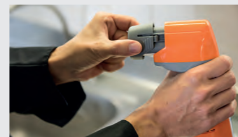
Der Akku kann schnell und einfach ausgetauscht werden.